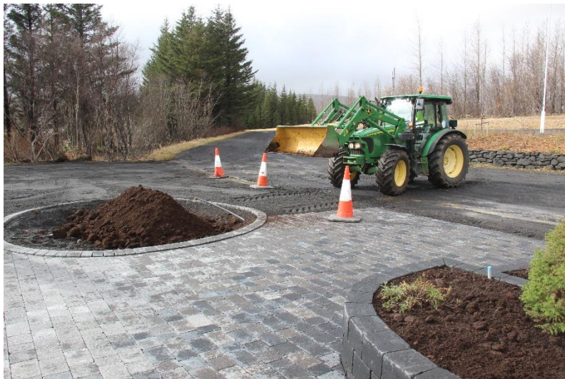
Skrúðgarðyrkja er löggilt iðngrein. Fagið er mikilvægur hlekkur í uppbyggingu þéttbýlis og borgarsamfélaga

Eftir 15 ár liggur ljóst fyrir að sameining starfsmenntanáms í garðyrkju við LbhÍ er tilraun sem misheppnaðist. Eðlilegt er að umræður um framtíðarskipan starfsmenntanáms í garðyrkju, sem er á framhaldsskólastigi, fari fram milli menntamálayfirvalda og atvinnugreinarinnar án afskipta einstakra háskólastofnana eða annarra rekstareininga.