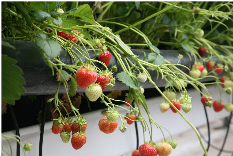
Íslensk jarðarber eru nú á boðstólnum stærri hluta ársins en áður var

„Ríkisstjórnin vill tryggja framhaldsskólum frelsi og fjármagn til eigin stefnumótunar innan ramma framhaldsskólalaga og kanna kosti sveigjanlegra skólaskila. Ráðist verður í stórsókn í uppbyggingu hjúkrunarrýma. Ríkisstjórnin ætlar að leggja sérstakra áherslu á listnám og aukna tækniþekkingu sem gera mun íslenskt samfélag samkeppnishæfara á alþjóðavísu. Iðnnám og verk- og starfsnám verður einnig eft í þágu fjölbreytni og öflugra samfélags. Jafnt aðgengi að námi óháð búsetu og öðrum aðstæðum verður meginmarkmið. Endurskoða þarf löggjöf um framhaldsfræðslu og setja skýran ramma um starfsemi menntastofnana og samstarf við atvinnulífð“.