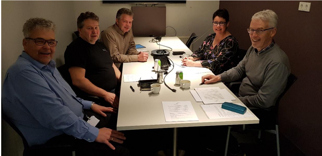
Frá undirritun kjarasamnings Samiðnar og Sambands garðyrkjubænda, 2019

hagsmunaaðilar í garðyrkju til þessa reynt að styðja skólann og starfsmenntanámið, m.a. með þátttöku í viðburðum, hagnýtum tilraunum og samstarfsverkefnum, með því að tala máli skólans við löggjafar- og fjárveitingavaldið, auk þess sem fólk og félög á vettvangi garðyrkjunnar hafa gefið gjafir til skólans og útskriftarnemenda. Nú hafa samskipti atvinnulífs og skólans hins vegar þróast með þeim hætti að ekki verður lengra haldið á þeirri vegferð og brýnt er að starfsmenntanámið öðlist frelsi frá LBHÍ svo núverandi ástand skaði ekki námið og atvinnugreinina meira en orðið er.