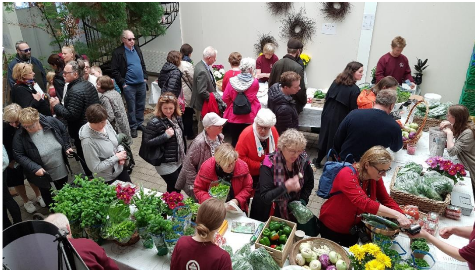
Það er að jafnaði glatt á hjalla að Reykjum á sumardaginn fyrsta

Ekki þarf að fjölyrða um hversu alvarleg þessi staða er gagnvart náminu og framtíð þess, nemendum og atvinnugreininni í heild.